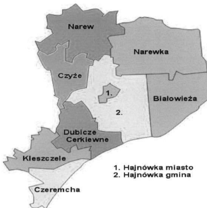
Rycina 1. Gmina Narew na tle powiatu hajnowskiego

Według danych Powszechnego Spisu Rolnego przeprowadzonego w 2010 roku, w Gminie Narew było zarejestrowanych 1051 gospodarstw rolnych, z czego 1047 to gospodarstwa indywidualne. Największą liczbę odnotowano dla gospodarstw rolnych o powierzchni 1–5 ha (25%), zaś najmniejszą dla gospodarstw o powierzchni powyżej 15 ha (15%). Działalność rolniczą prowadziło ogółem 857 gospodarstw rolnych. 395 gospodarstw utrzymuje zwierzęta gospodarskie. Łączna liczba pogłowia zwierząt gospodarskich w sztukach dużych wynosi 14251 sztuk.